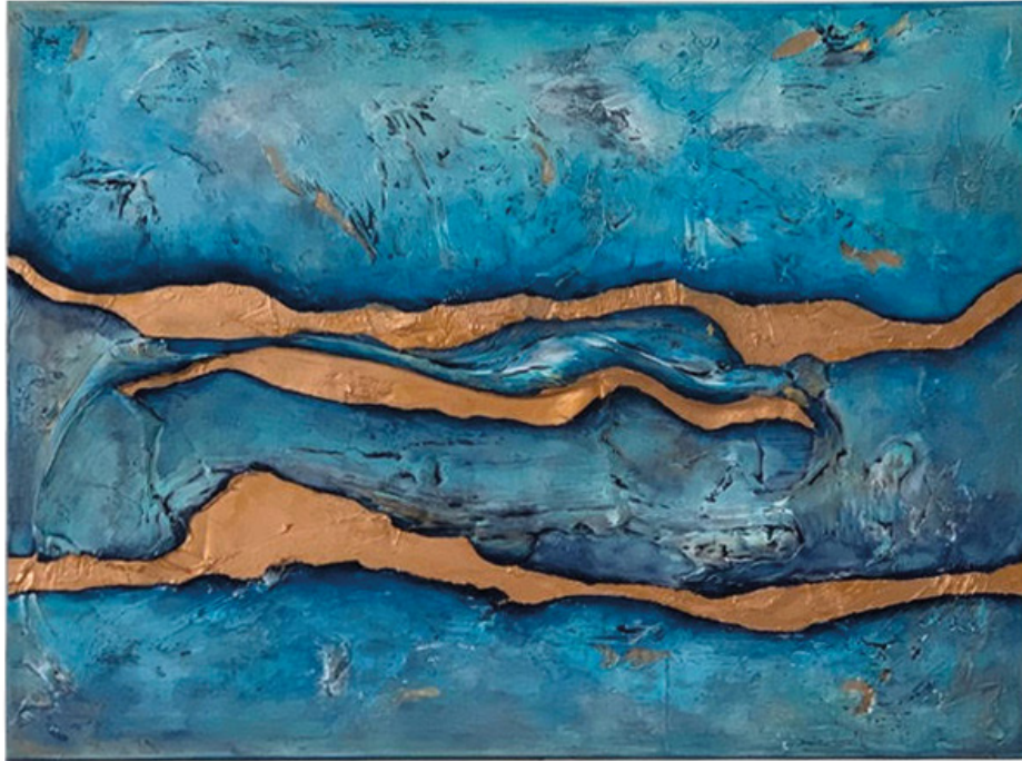
Emotion Of The Sea , 60x80