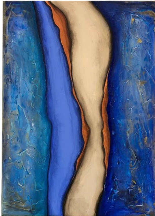
Like Sand , 40x80