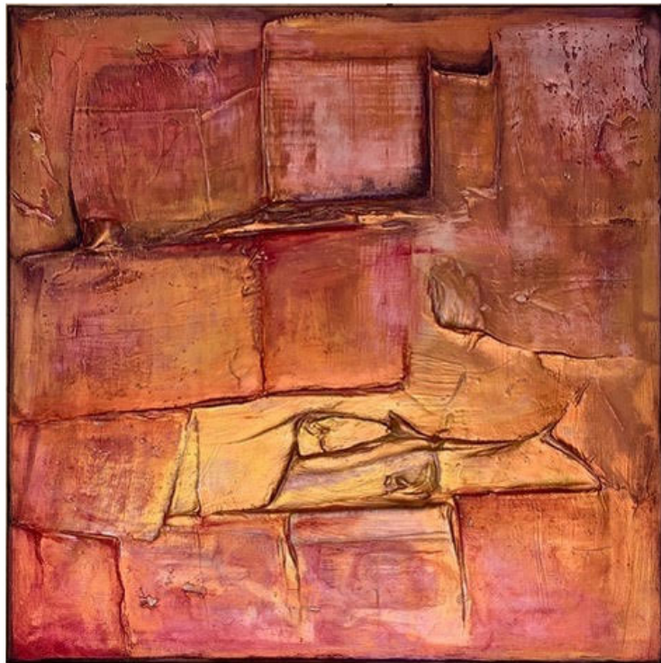
Gold Sunset , 50x50