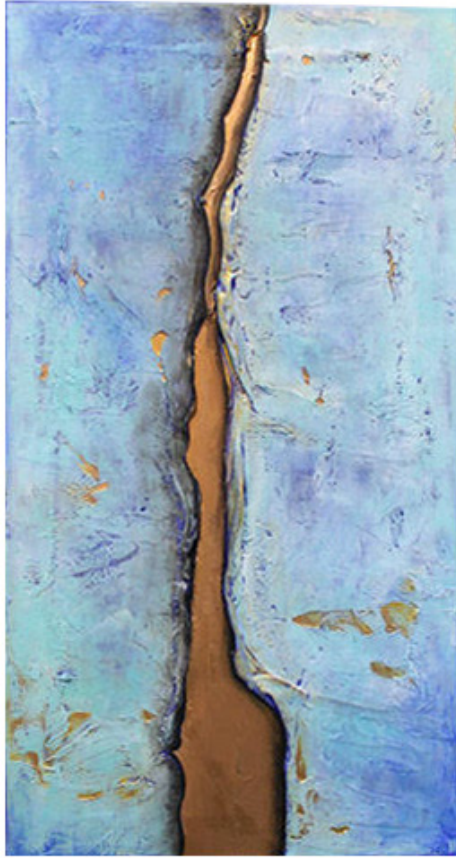
The Integrity Of The Sea , 40x80