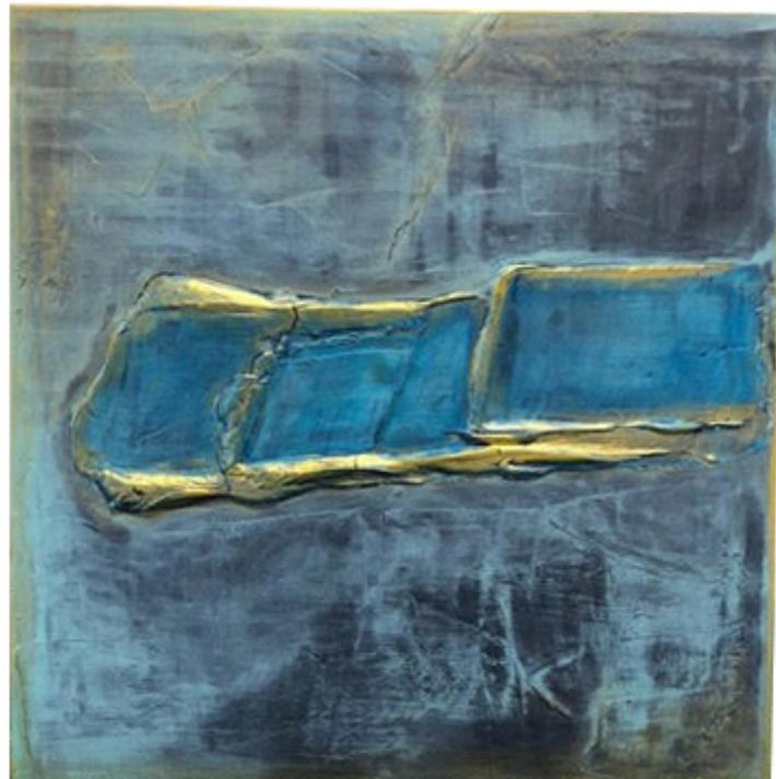
Easy Life At The Sun , 50x50